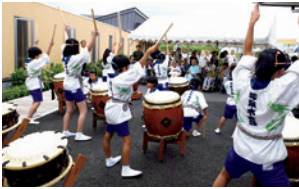
▶ 子どもたちによる和太鼓の演奏。普段介護に関心のない世代に、施設に来てもらうきっかけにもなる