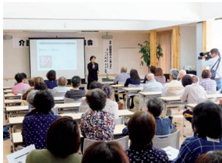
▲ 認知症に関する講演会は、地域からの注目も高かった

地域に開かれた施設づくりを徹底 長野県中部に位置し、南北に細長い地形をしている立科町。1988年に特別養護老人ホームの開設を皮切りに、立科町を中心に介護事業を展開している社会福祉法人ハートフルケアたてしなは、町からの要望もあり昨年4月に特養「すずらん」の増床とユニット化を実施した。ユニット型への変更に伴い利用者の動揺も考えられたが、比較的にスムーズに済んだとのこと。「ショッピングセンターの目の前に移転することになりましたので、開設前から『何ができるのか?』と地域の方から