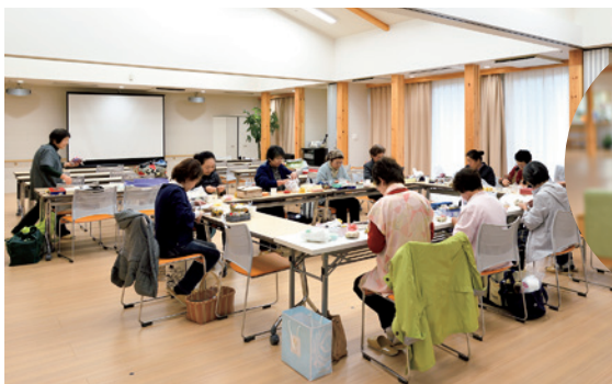
▲つるし雛サークルのメンバーは、毎週地域共生スペースでサークル活動を行う