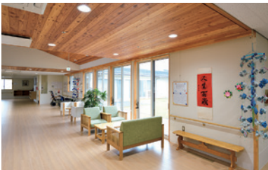
▲ 施設ロビーは中庭を挟んでいるため明るく、開放的