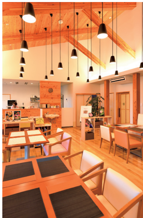
▲木がふんだんに用いられた「カフェひといき」では、地域の人向けの笑いヨガの講座などを取り入れた「認知症カフェ」を開催した