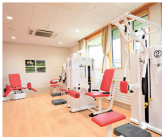
▲デイサービスの利用者に好評なパワーリハビリのマシーン