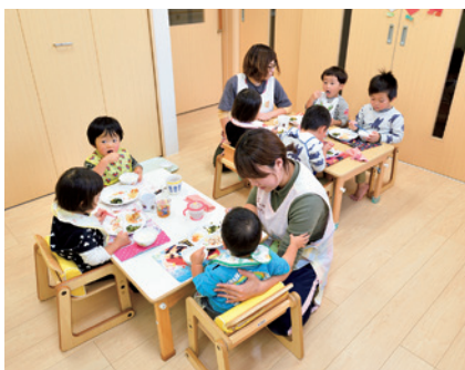
▲施設内保育所も併設されており、子どもたちの笑い声も絶えない